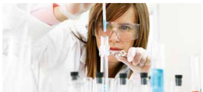
Now and then – Research and development make up a vital part of our company's core competence.