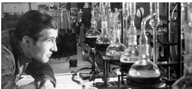
Damals wie heute – Forschung und Entwicklung gehören zu den Kernkompetenzen unseres Unternehmens.

ADDINOL bietet intelligente Lösungen, die eine optimale Schmierung sicherstellen und gleichzeitig einen verantwortungsvollen Umgang mit der Umwelt gewährleisten. Viele unserer Hochleistungs-Schmierstoffe steigern ganz entscheidend die Energieeffizienz von Anlagen und Motoren. Sie verfügen über deutlich längere Standzeiten als herkömmliche Produkte und erhöhen die Lebensdauer der geschmierten Komponenten.